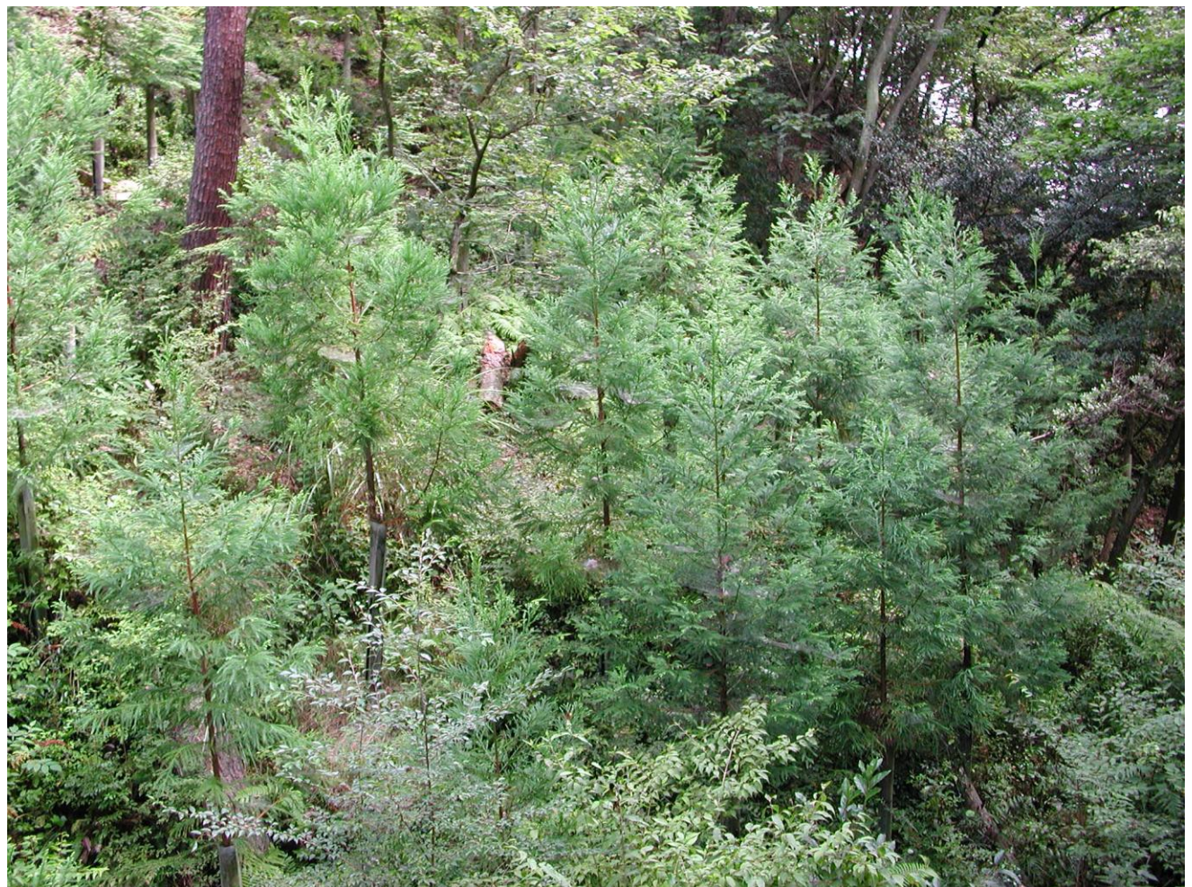
3成長期間経過したスギ

2002年8月撮影。治山ダム周辺の復元緑化。植栽木はスギ・ヒノキ。 「ヘキサチューブ」の需要の多くは、当時治山事業。間伐推進が国策で、皆伐再造林面積が激減した時期だった。3成長期間した現場で、スギ・ヒノキとも4mを優に超えている。活着もよく、シェルターの「成長促進効果」が発揮された現場である。